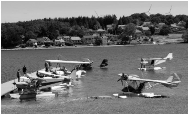
Bingo, Wheedhopper, Renegade, Trophy TT2000, Seamax... au total 10 ULM hydro sur le plan d'eau de Villefranche-de-Penat pour Aveyrolacs 2015

L'édition 2015 d'Aveyrolacs a réuni une dizaine d'ULM hydro sur l'hydrobase de Villefranche de Panat, en Aveyron, du 14 au 16 août 2015. Les appareils sont venus d'un peu partout de France et même du lac Léman, certains en vol, d'autres par la route. Cinq d'entre eux ont pu participer à une randonnée au départ du plan d'eau de Villefranche de Panat qui les a conduits sur deux autres plans d'eau. Ce rassemblement annuel est en passe de devenir un temps fort de la saison pour les pilotes ULM d'hydro.