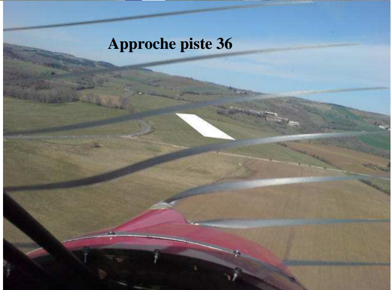
Approche piste 36